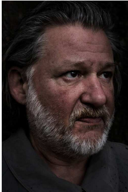
Simone Perolari photography

Anne-Sylvie Sprenger, L'Hebdo , 28 juillet 2005