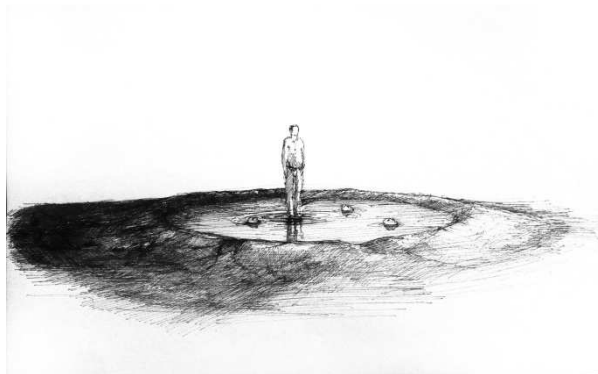
Croquis Benjamin Gabrié