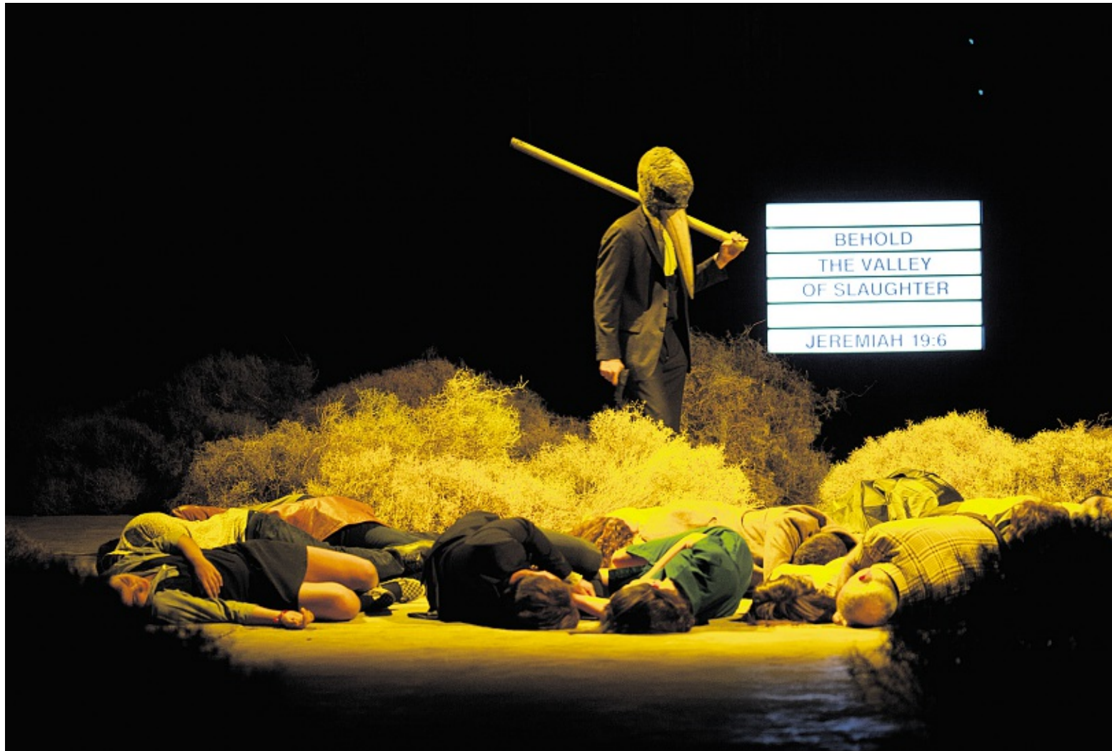
« Don Quixote », par le Blitz Theatre Group, une des compagnies les plus créatives d'Athènes.