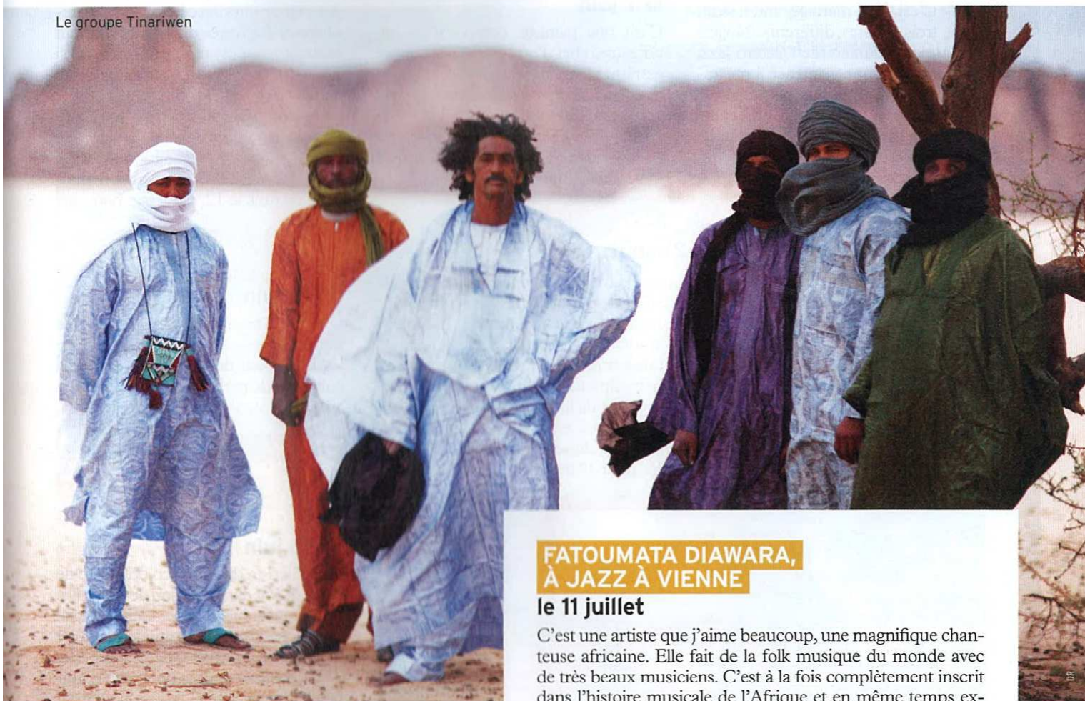
Le groupe Tinariwen

donnera une représentation à l'Opéra-théâtre de Saint-Étienne. C'est vraiment un coup de cœur! Quant au festival, c'est un peu le petit frère des Nuits de Fourvière. Les 7 Collines mêlent musique, théâtre et cirque, on y est très attachés.