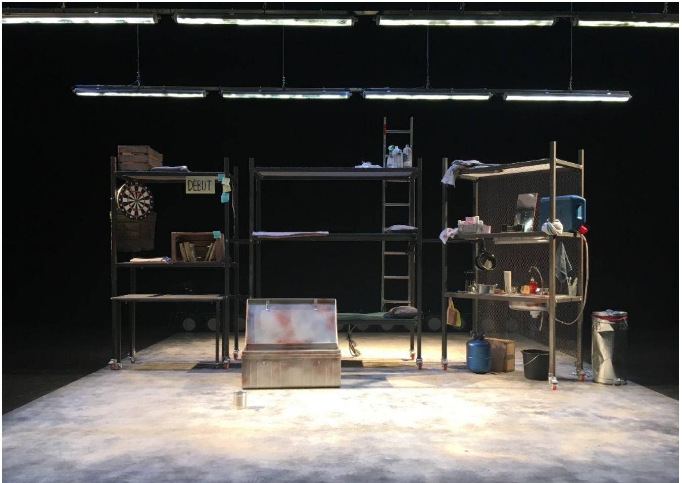
Photo réalisée en version salle